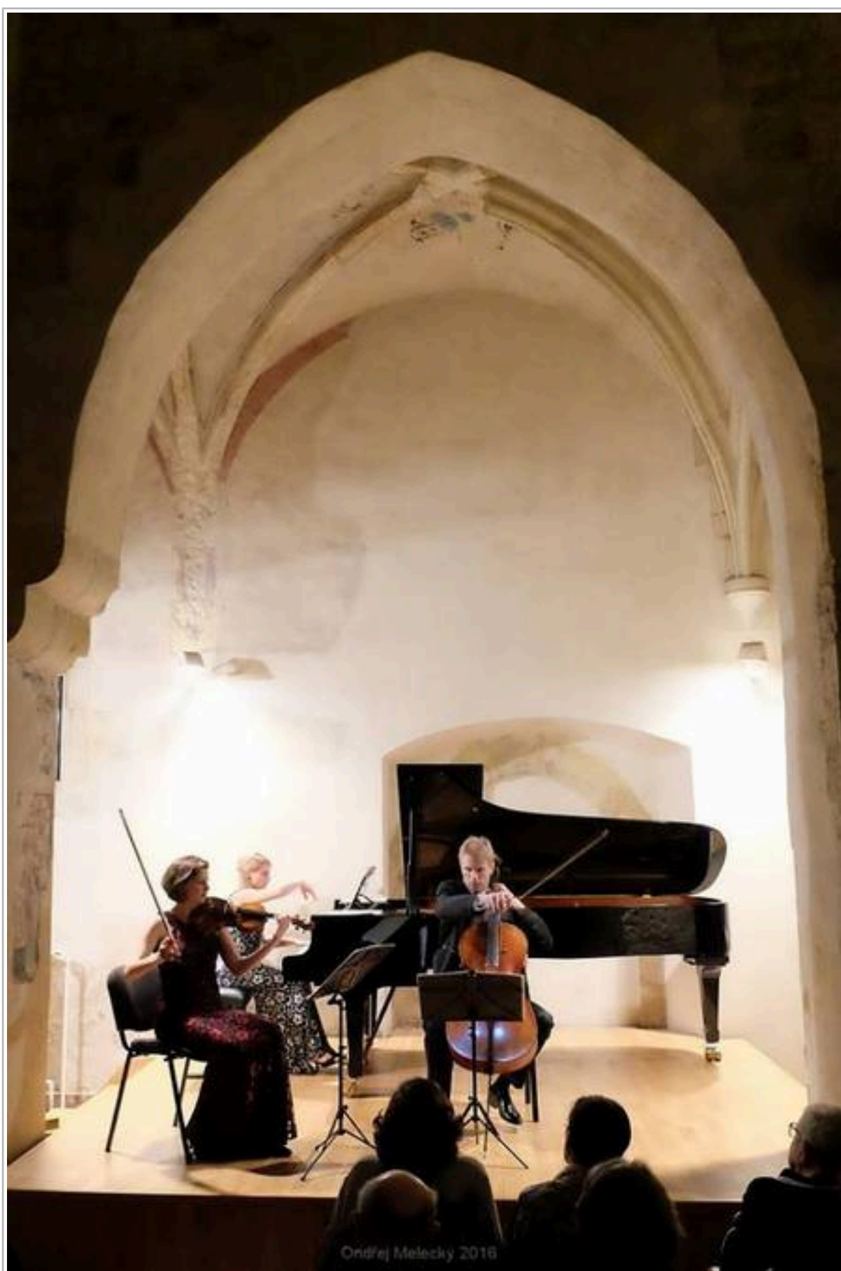
Kinsky Trio Prague